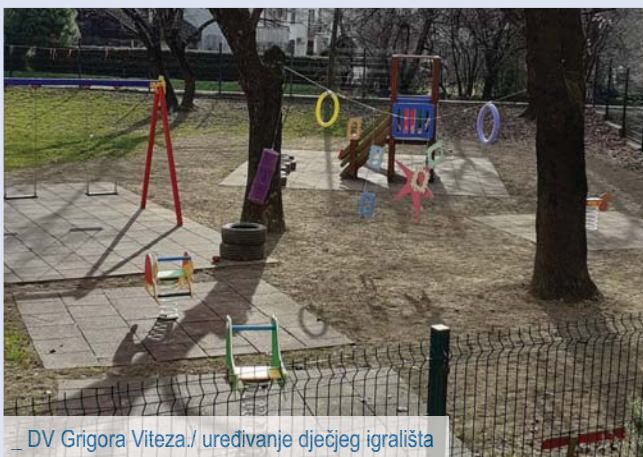
_ DV Grigora Viteza./ uređivanje dječjeg igrališta