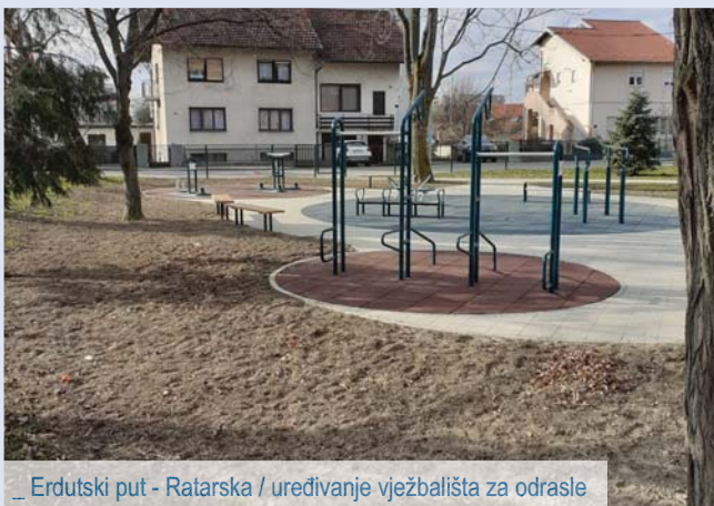
_ Erdutski put - Ratarska / uređivanje vježbališta za odrasle