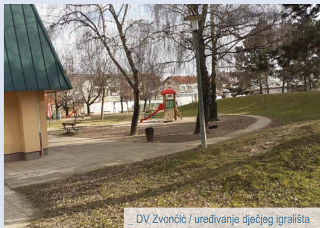
_ DV Zvončić / uređivanje dječjeg igrališta