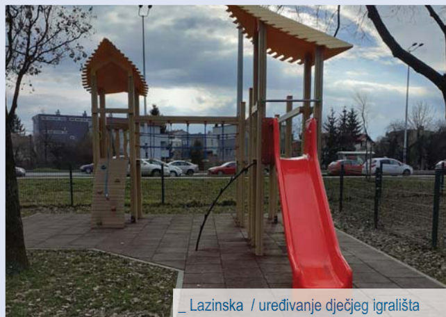
_ Lazinska / uređivanje dječjeg igrališta